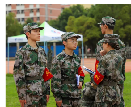
本版文字：孙琪琪

勤奋，务实 晴天，雨天 不能做训练场上的“小迷彩” 但能做“小迷彩”们的坚强后盾