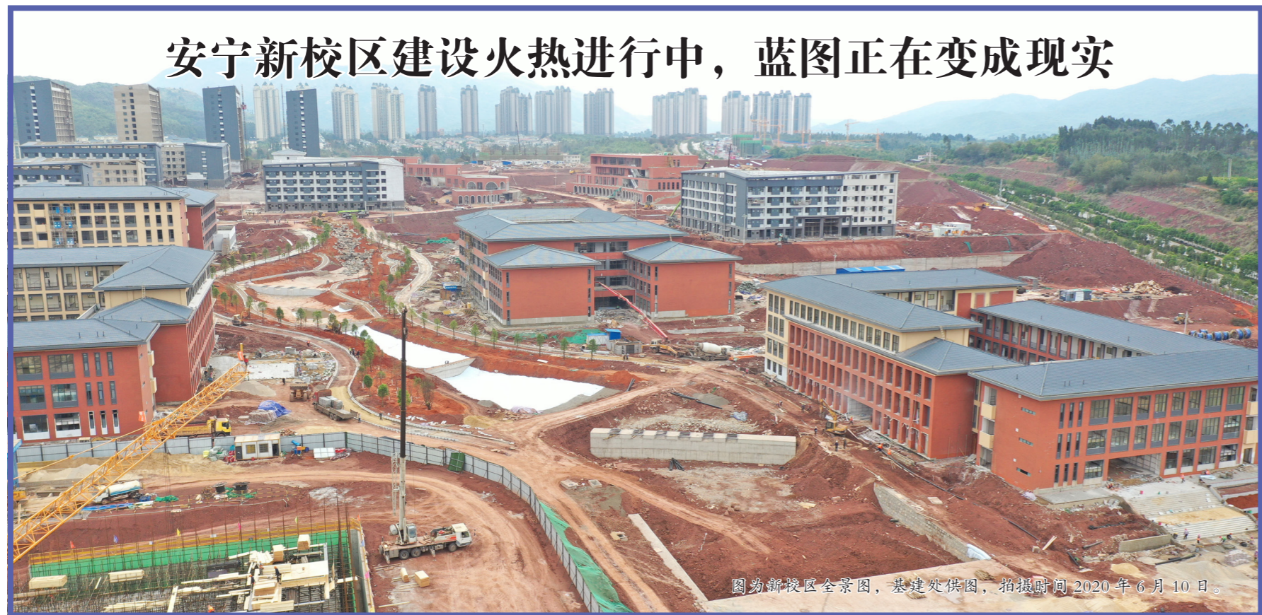
图为新校区全景图，基建处供图，拍摄时间 2020 年 6 月 10 日。

夏季可能会有其他传染病的发病，因此学校的管控过程中，要将食堂的卫生安全问题提上重要日程，对食堂餐饮服务人员的健康防护要严格标准。同时，可向学生提供一些调整体内环境的预防方，对于易感体质、易感人群采取一些预防措施，尽量避免其受到夏季传染病的病原微生物感染。（转载自 2020 年 6 月 12 日教育部网站，网络链接： http://www.moe.gov.cn/jyb_xwfb/moe_1946/fj_2020/202006/t20200612_465535.html ）