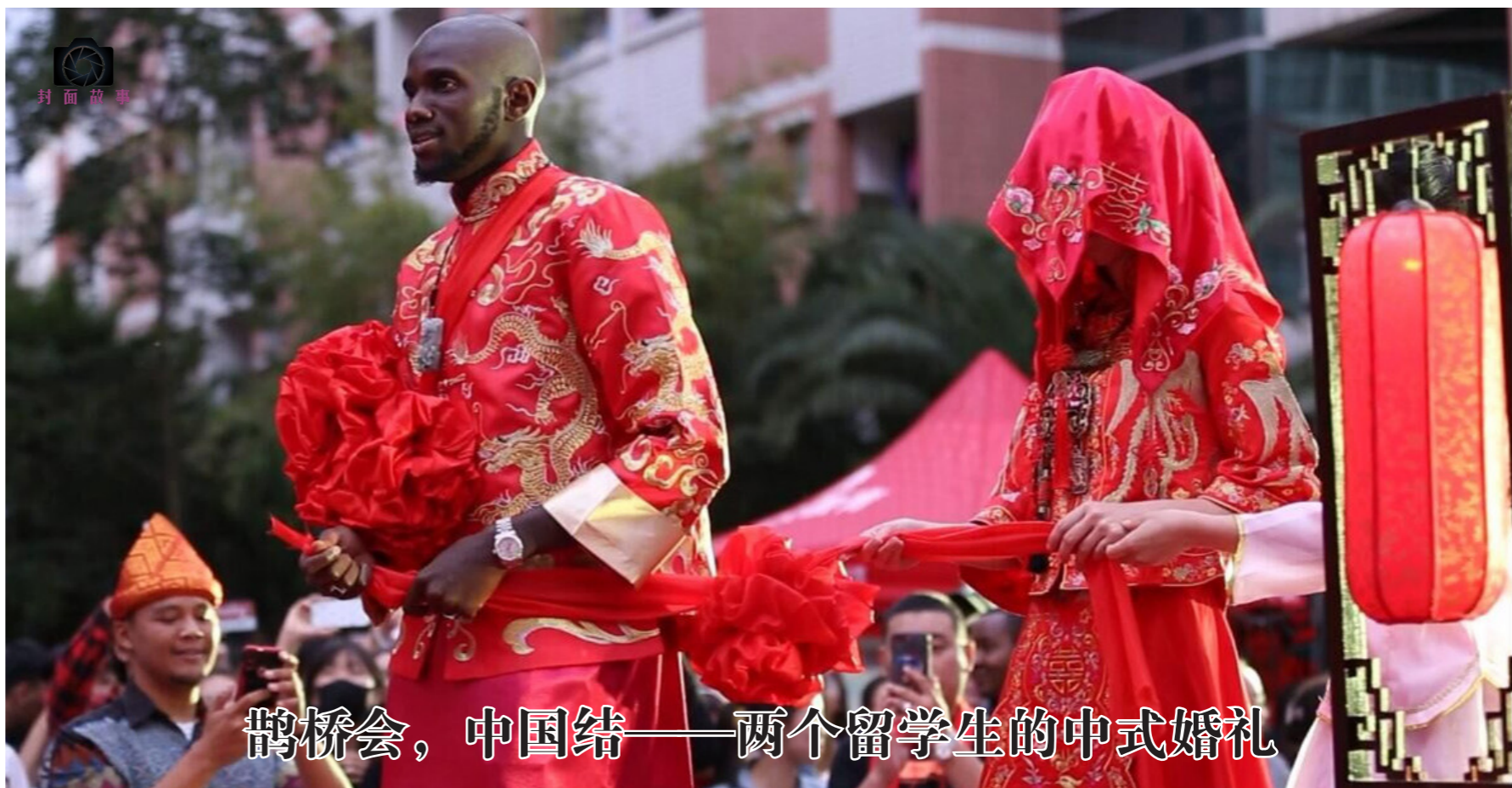
鹊桥会，中国结——两个留学生的中式婚礼

校党委统战部部长张向英、科研院(中心)党委书记荣小红、校纪委书记、中华职业学院党委书记吴应利、党委宣传部副部长李晓霞、党委学工部副部长、学生处副处长曾蕾、校团委副主席李娟、校团委书记保伟担任比赛评委。记者 李玲娜 卢东旭